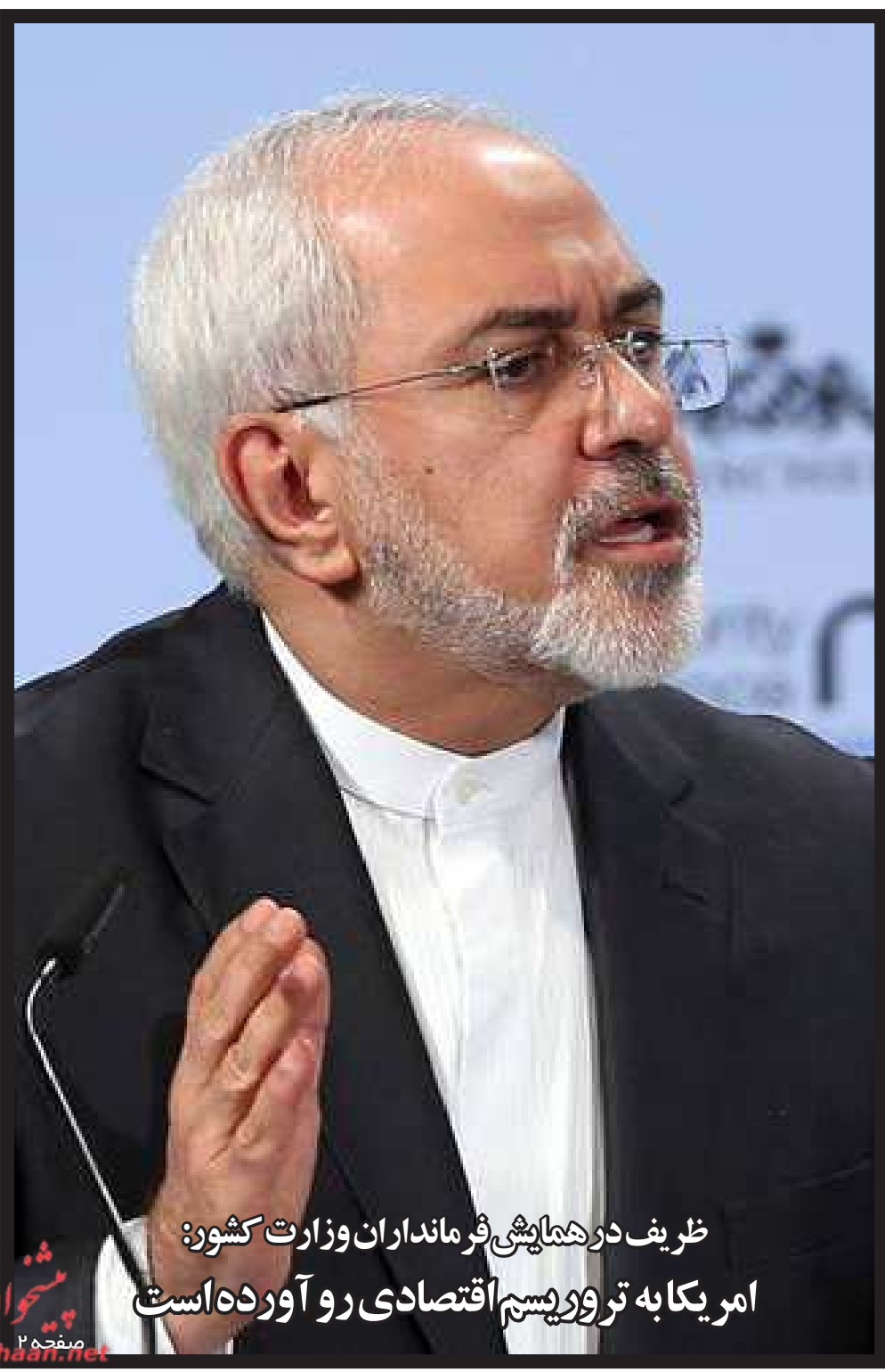
ظریف در همایشی فرمانداران وزارت کشور: امریکا به تروریسم اقتصادی رو آورده است

نیمی از واقعیت زشت تر از تمامی یک دروغ است