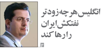
انگلیس هر چه زودتر نفتکش ایران را رها کند