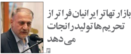
بازار تها تو ایرانیان فراتر از تحریم ها تولید رانجات می دهد