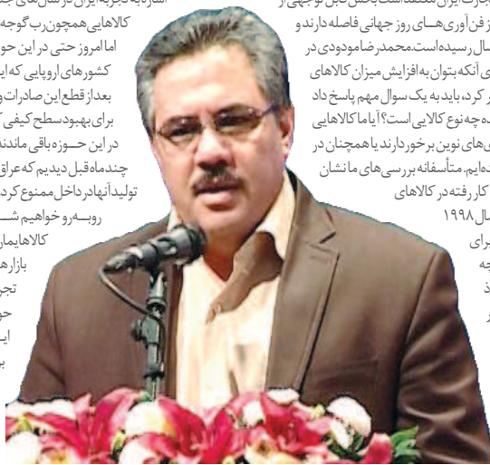
شرکت نفت قصد فروش املاک زنجانی را دارد