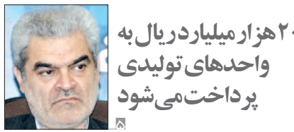
۲۰۰ هزار میلیارد ریال به واحدهای تولیدی پرداخت می شود