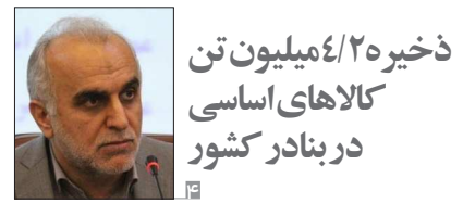
ذخیره ۴/۲ میلیارد تن کالاهای اساسی در بنادر کشور