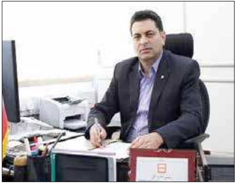
محسن کریمی، رئیس اداره کل نقدینگی و خزانه‌داری بانک مسکن از پیش ثبت‌نام گروهی از مشتریان بانک مسکن در «باشگاه مشتریان سجام» خبر داد و گفت: این افراد به زودی پیامکی در این خصوص دریافت می‌کنند. محسن کریمی در گفت‌وگو با پایگاه خبری بانک مسکن - هیتا با بیان اینکه اطلاعات سرمایه‌گذاران در صندوق راه‌آورد آباد مسکن چندی پیش در باشگاه مشتریان سجام بارگزاری شده و مشکلی از بابت این گروه از مشتریان بانک مسکن که مشمول ثبت نام در سجام هستند، وجود ندارد اظهار کرد: در حال حاضر اولویت بانک مسکن ثبت نام سپرده‌گذاران ممتاز بانک مسکن در سجام است؛ چرا که تنها در این صورت این افرادی می‌توانند اوراق حق تقدم استفاده از تسهیلات مسکن را که به عنوان بخشی از سود به آنها